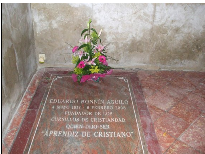
EDUARDO BONNIN AGUILO 4 MAYO 1917 - 6 FEBRERO 2008 FUNDADOR DE LOS CURSILLOS DE CRISTIANDAD QUIEN DIJO SER “APRENDIZ DE CRISTIANO”

Con los mismos esquemas de lecciones, o rollos, utilizados en Cala Figuera, salvo mínimos cambios, se dieron 4 cursillos más entre 1945 y 1948, y todos los demás cursillos que se han celebrado hasta el día de hoy. Incluío el cursillo celebrado en San Honorato el 7 de enero de 1949, al que, tras la “euforia” de la Peregrinación a Santiago, se decidió numerarlo oficialmente como el cursillo número 1.